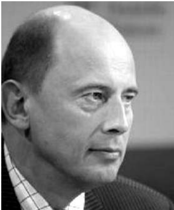
Bundesminister Wolfgang Tiefensee

Am 15. und 16. Juni fand in Hamburg die IX. Deutsch-Russische Städtepartnerkonferenz statt. Die Durchführung der Konferenz, die vom Deutsch-Russischen Forum, dem Bundesverband Deutscher West-Ost-Gesellschaften und der russischen Internationalen Assoziation für Partnerstädte veranstaltet wurde, wurde unterstützt vom Hamburger Senat, der Stiftung West-Östliche Begegnungen und der Metro Group Asset Management.