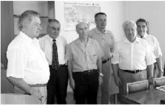
Begegnung mit Veteranen der Sowjetarmee

Zeit nicht vergönnt, diesen zu besuchen.