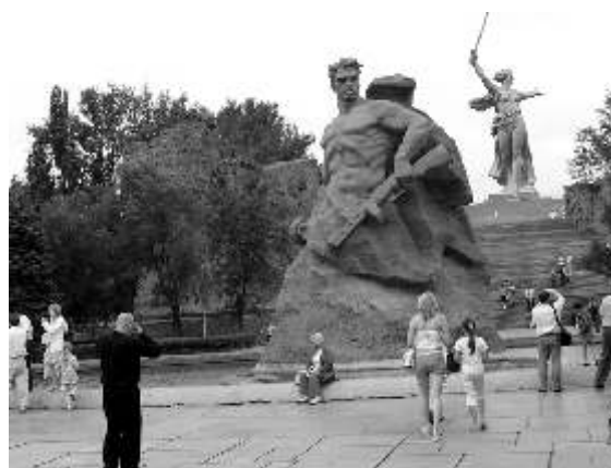
Der Mamajew-Hügel mit "Mutter Heimat"

In der Schlacht von Stalingrad verloren über 3 Millionen Menschen ihr Leben, 2 Millionen auf russischer und 1,5 Millionen auf deutscher Seite.