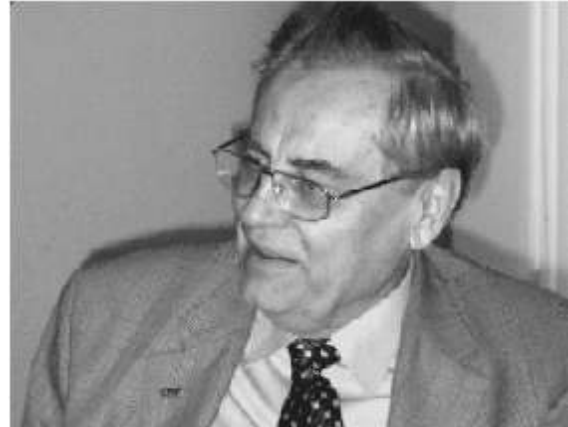
Im Gespräch mit dem Duma-Abgeordneten und vormaligen Botschafter der UdSSR in Bonn, July Kwisinskiy